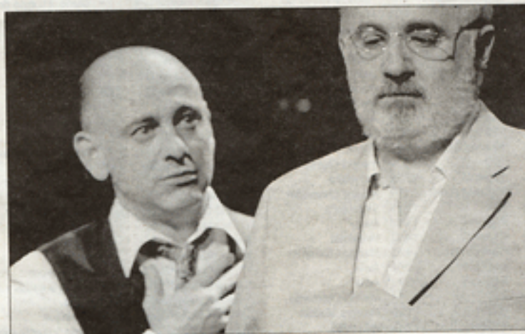
El público barcense disfrutó con la representación.

de junio serán los granadinos de Pinos Puente Diván Teatro quienes con su versión del clásico Fuenteovejuna , sin duda harán disfrutar a un público entregado