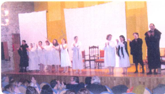
MEJOR GRUPO Teatro Lagasca por La casa de Bernarda Alba